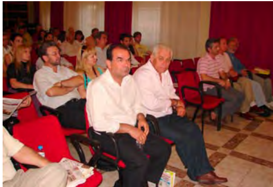
Παρών και ο νομάρχης Ροδόπης Άρης Γιαννακίδης

φθάσαμε στο απόγειο της γνώσης μας, νομίζουμε ότι τα πράγματα όπως γίνονταν χτες θα γίνονται και σήμερα.